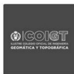
COIGT Colegio Oficial de Ingeniería Geomática y Topográfica